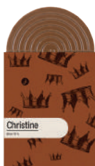
CHRISTINE TABLETTE CHOCOLAT NOIR BRESIL 70%