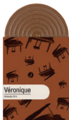
VÉRONIQUE TABLETTE CHOCOLAT NOIR VENEZUELA 70%