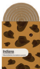
INDIANA TABLETTE GOURMANDE CHOCOLAT LAIT MADAGASCAR 43%