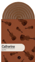
CATHERINE TABLETTE CHOCOLAT NOIR JAVA 70%