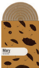
MARY TABLETTE GOURMANDE CHOCOLAT LAIT AU SEL DE GUÉRENDE