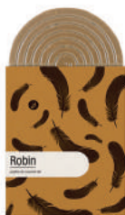
ROBIN TABLETTE GOURMANDE CHOCOLAT LAIT AUX PÉPITES DE CAMEL