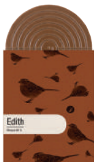
EDITH TABLETTE CHOCOLAT NOIR MEXIQUE 66%