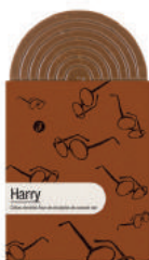
HARRY TABLETTE GOURMANDE CHOCOLAT NOIR VENEZUELA 70%

Dans les mondes enchantés de Bretagne, les braves n'ont peur de rien et vont au bout de leurs rêves heureux et mouvementés, pavoisés de fleur de sel, crêpes dentelles et pépites de caramel.