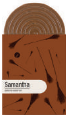
SAMANTHA TABLETTE GOURMANDE CHOCOLAT NOIR AUX PÉPITES DE CAMEL