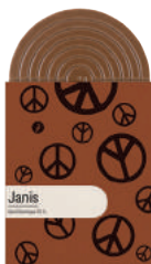
JANIS TABLETTE CHOCOLAT NOIR ST DOMINGUE 70%