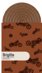
BRIGITTE TABLETTE CHOCOLAT NOIR SAO TOMÉ 67%

Hommage à ces chanteuses mythiques, sensibles et intenses, avec des profils aromatiques doux, fruités, épicés, parfois mêlés d'un soupçon d'amertume, d'un souffle de fumée, toujours équilibrés.