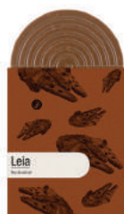
LEIA TABLETTE GOURMANDE CHOCOLAT NOIR À LA FLEUR DE SEL