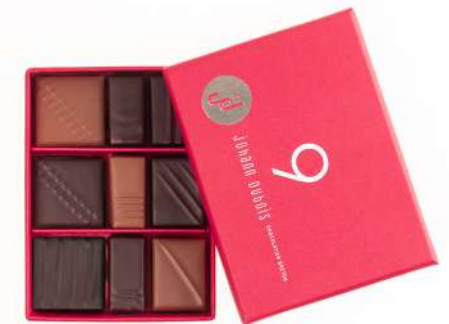
COFFRET 9 CHOCOLATS