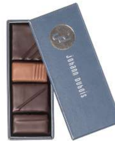
COFFRET 4 CHOCOLATS